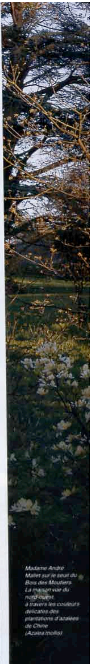
Madame Andre Mallet sur le seuil du Bois des Moutiers. La maison vue du nord-ouest à travers les couleurs délicates des plantations d'azalées de Chine (Azalea mollis)